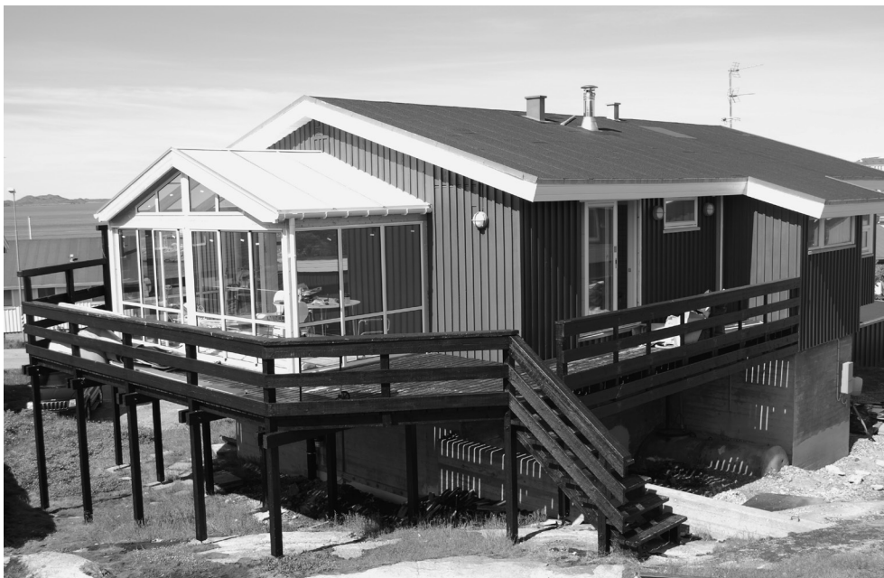
Figur 2: Centret skal bidrage til at skabe et sammenhængende tværfagligt udrednings- og behandlingsforløb for børn, der har været udsat for seksuelle overgreb, ligesom det skal fungere som et rådgivnings- og videnscenter for kommuner og andre aktører, der kommer i kontakt med seksuelt misbrugte børn. Centret i Nuuk åbnede august 2011

De få undersøgelser, der er blevet foretaget i Grønland, angiver, at op til en tredjedel af landets 56.000 indbyggere har været udsat for seksuelle krænkelse under opvæksten.